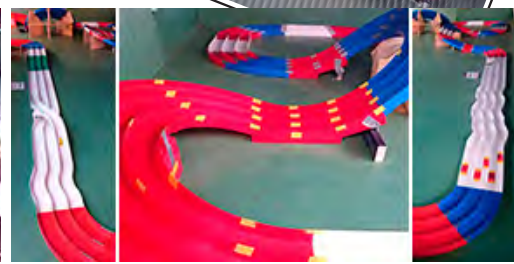
※当店サーキットイメージ。当日のレイアウトとは異なります。